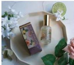
オードトワレは全部で6種

3月末には新商品のオードトワレ も発売されるので、より一層 PERFUMERSの香りを色々なアイ テムで楽しんでいただけます。