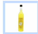
クラフトリキュール YUZU

生産者のみなさんが、 農薬を使わずに有機肥 料だけで栽培した、幻 の石川県産国産柚子の リキュールです。ロッ クやソーダ割りはもち ろんのこと、ビールで 割ったビアカクテルも おすすめです。かき氷 やパニタアイスにかけ て、大人のデザートと してもお楽しみいただ けます。